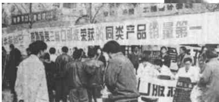
3.15消费者权益日活动一角